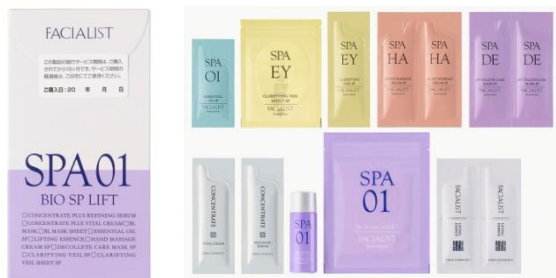
「SPA01」1回分 18,000円(税抜) トータルエイジングケアのためのセット

※4 エイジングケア・・・年齢肌にハリやうるおいを与えること ※5 美白・・・メラニンの生成を抑え、日やけによるシミ・ソバカスを防ぐ