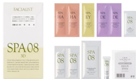
「SPA 08E」1回分 16,000円(税抜)